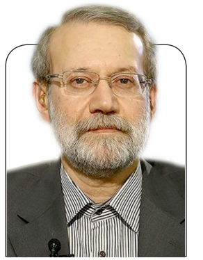
علی لاریجانی رئیس مجلس دهم:

فکر نمی کنم احمدی نژاد در ایران خیلی جاذبه ای داشته باشد، مخصوصا که خیلی تجربیات موفقی هم نداشته است