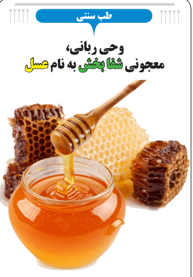
طب سنتی و حی ربانی، معجونی شفا بخشی به نام عسل