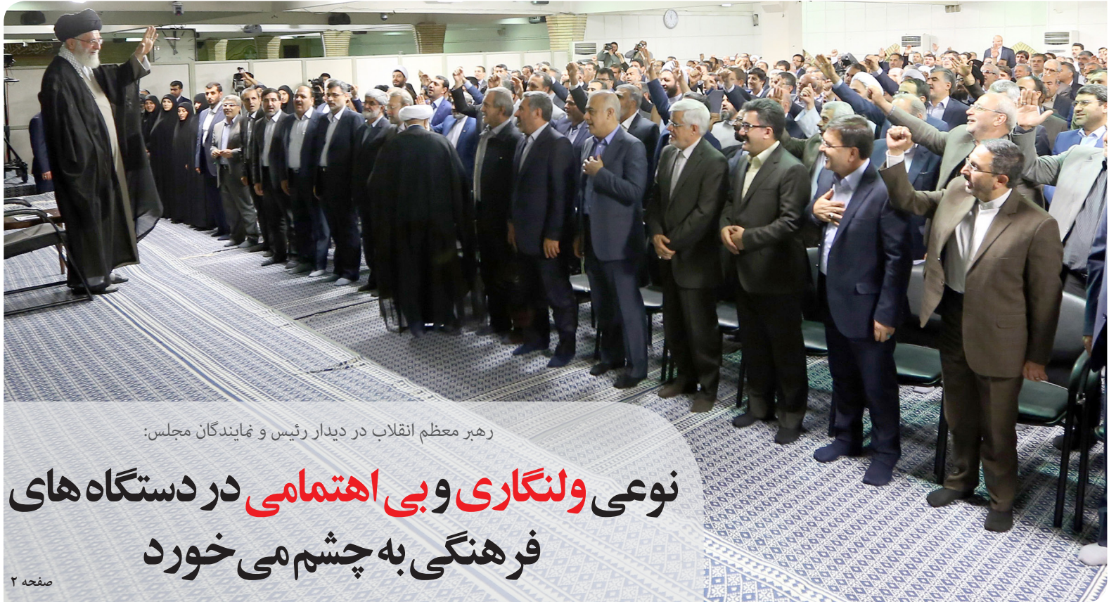
رهبر معظم انقلاب در دیدار رئیس و نمایندگان مجلس:

حسن ضیاءالدینی - اگر تیر دانه دندبا فرارسیدن فصل برداشت محصول زراعی انگار ورژن های بازار تغییر محسوسی به خود می گیرند و تنها کالایی که در این بازار خریداری نداشتیم چه فرصت خوبی است این ماه برای زدودن دل و اندیشه از هر زنگار اندکی فاصله از همه دعوای سیاسی، اندیشه نداشتن به تنشها و منازعات دنیایی. و رمضان این فرصت را در اختیار ما میگذارد که اندکی با خود و دل خلوت کنیم. آرامشی را احساس کنیم که جایزه و صلح پیوند با خداست. همین که به فکر آب و نان نیستیم، لب از طعام و شراب فرو میبندیم و کمتر گناه میکنیم، جانمان نفس میکشد. بی جهت نیست که در رمضان جرم و جنایت کمتر می شود. دعوا هم کمتر می شود. دادگاهها هم خلوت تر می شوند. کلاسترها هم مراجعین کمتری دارند. اما تنها این که نیست. فاصله گرفتن از دغدغه های مدام و همیشگی زمینی هم خود غنیمتی است. اصلا یاد خدا غنیمت است. این را حتما تجربه کرده اید که به سوی او که میروید آرام می گیرید. ما به چنین فرصتی سخت نیازمندیم. پس خوشامد می گویم به این ماه و به این فرصت بی بدیل. اما چه خوب است که در این ماه به چند نکته نیز توجه کنیم. اینها نصیحت نیست، موعظه هم نیست. نه مقام این سخن، این را می طلبید و نه نگارنده را چنین داعیای است. تنها این را به حساب نوعی امر به معروف و نهی از منکر بگذارید. حال اینها چه هستند؟