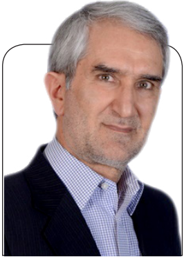
دکتر امیری نماینده مردم در مجلس:

در چار چوب اقتصاد مقاومتی فضای توسعه معدنی استان را باید تسهیل کنیم و تولید را روان کنیم