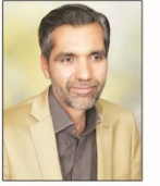
مقام معظم رهبری:

مهم ترین وظیفه مطبوعات در نظام اسلامی، نقش فرهنگی آنان در معرفی و دفاع از ارزش ها و آرمان های مورد قبول این امت انقلابی و بالا بردن سطح آگاهی و معرفت آنان است.