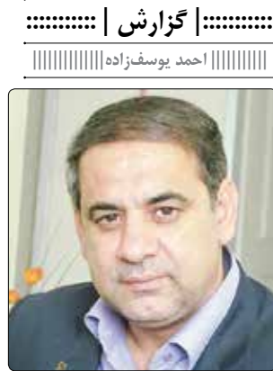
گزارش | ..... احمد یوسفزاده | .....

ایران از هر نقطه ممکن است به خاک شما یورش بیاورد، آلا از منطقه فاو. ژنرال‌ها گفته‌اند هیچکس نمی‌تواند از دریای موج خیزسز ارونند بگذرد. گفته‌اند پای گذاشتن غواص در ارونند همان و پیدا شدن جنازه‌اش در شکم نهنگان خلیج فارس همان. گفته‌اند ارونند نابکار است، در اثر جزر و مد مسیر حرکتش را تغییر می‌دهد. گفته‌اند ارونند ریاکار است، سطح آبش آرام، اما لایه‌های زیرینش پر شتاب می‌گذرد. گفته‌اند ارونند موج که بشود هیچ‌کس جلودارش نیست و گفته‌اند گرداب‌هایی دارد که با سرعت سیصد کیلومتر طعمه‌اش را به غرقاب نابودی می‌کشاند و می‌بلعد.